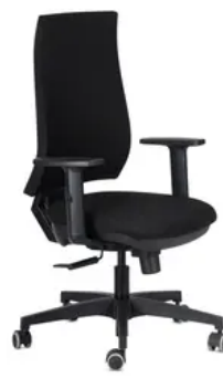
Schienale e sedile Alba nero