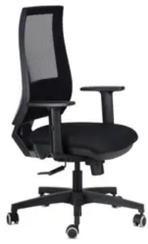
Schienale rete nera Sedile Alba nero